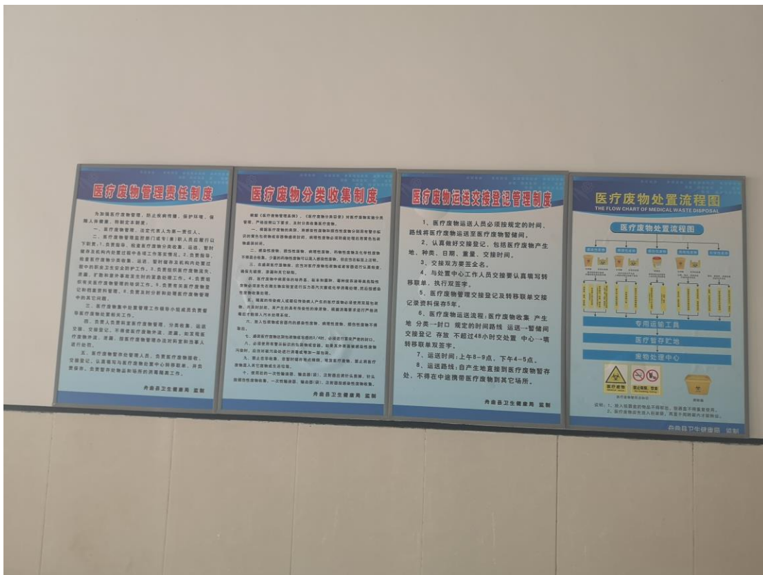
医疗废物的管制、收集及处置流程