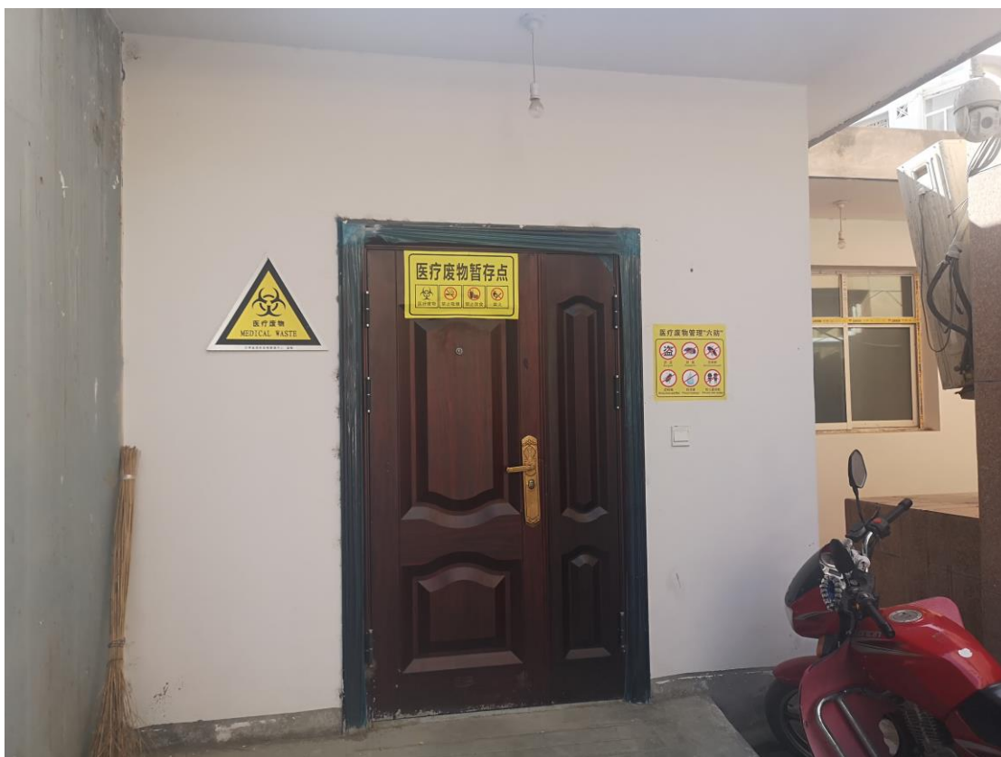
危废暂存间的标识设置